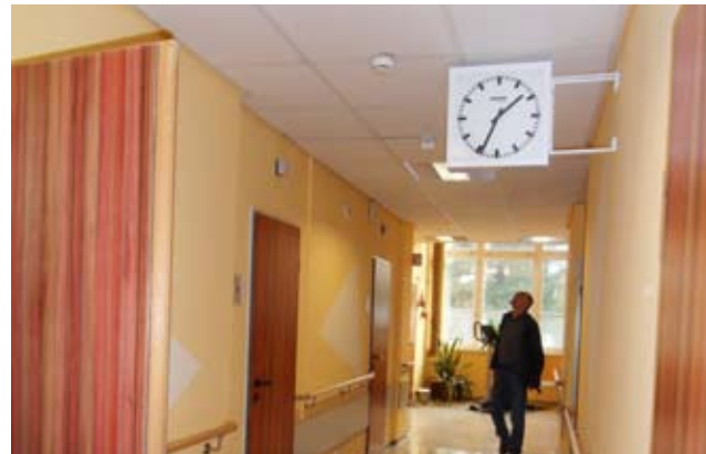
Universitätsklinikum der TU Dresden „Carl Gustav Carus“ Haus 7