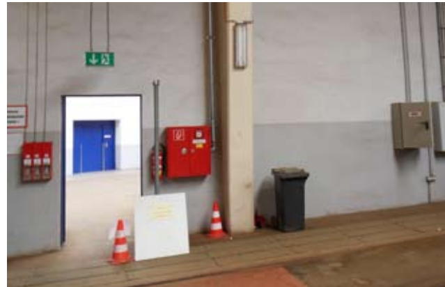
Straßenbahnhof Angerbrücke, Leipzig