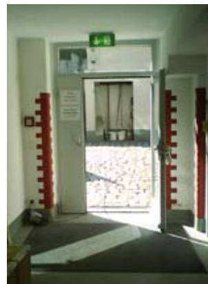
TU Bergakademie Freiburg Wernerbau