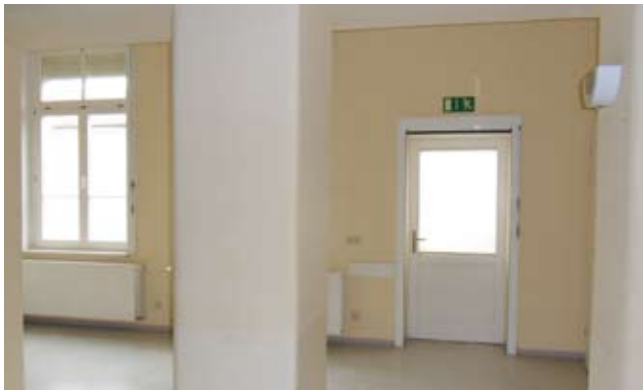
Universitätsklinikum der TU Dresden „Carl Gustav Carus“ Haus 15