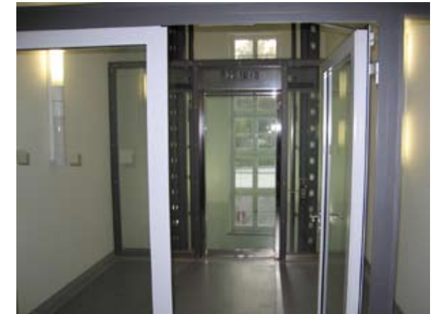
Umnutzung des ehemaligen Finanzamtes Weimar zum Verwaltungsgericht