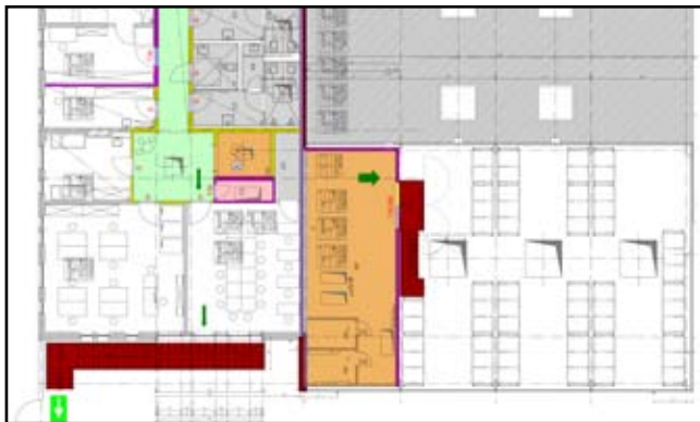
Werkstatt für Behinderte der Lebenshilfe OV Dresden e.V.